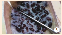
⑤ あら熱がとればぬらした包丁で対角線に切り、周囲にも切りこみを入れます。パックごと水に浸けて取り出します。