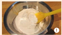
① だんご粉・砂糖を量ってボウルに入れ、よく混ぜます。