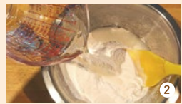
② 水を3回に分けて加え、ダマができないように混ぜ合わせます。