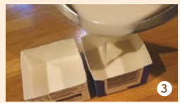
③ ②を大きじ2程度取り分けず。残りを牛乳パックに注ぎ、600wの電子レンジで約3分加熱します。