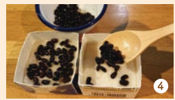
④ ③の表面が固まれば小豆をのせ、取り分けた液を注ぎます。生地の様子を見ながらもう2〜3分加熱。